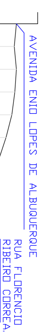
PERFIL LONGITUDINAL ESCALA HORIZONTAL 1:1000 ESCALA VERTICAL 1:100

TRIECHO DAS RUAS ERCI DICK , BERNARDINO LOPES DE ALBUQUERQUE E FLORENCIO RIBEIRO CORREIA ESCALA: 1/800 INICIO CALÇAMENTO ..... ESTACA 0 FIM CALÇAMENTO ..... ESTACA 8 LARGURA DA ESTRADA 0 ATÉ A 9 = 8,00 m