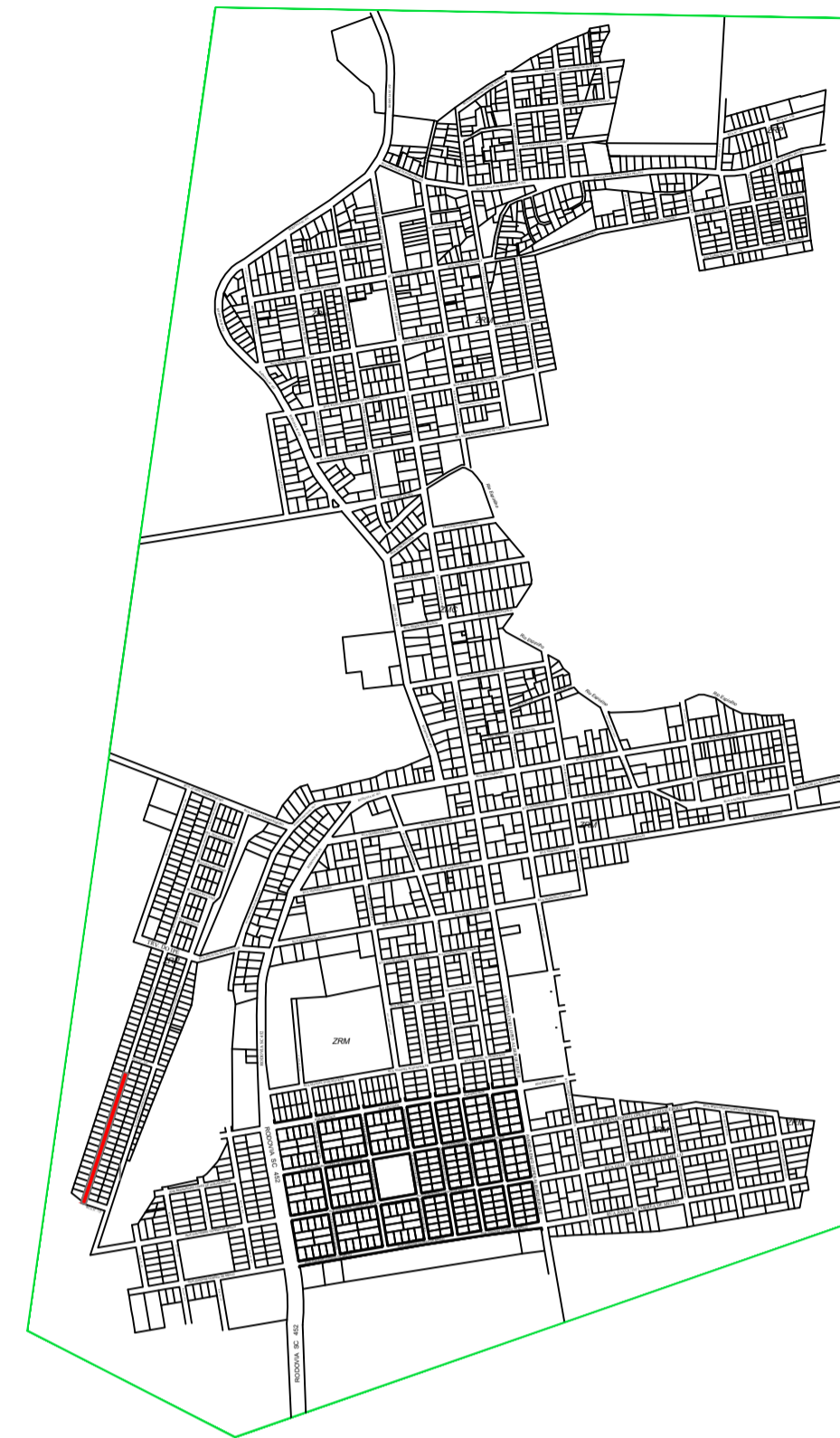
Perímetro Urbano de Monte Carlo-SC

Escala Horizontal: 1/500 Escala Vertical: 1/166